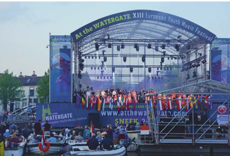
Eröffnungsfeier / cérémonie d'ouverture XII. European Youth Music Festival in Sneek, NL (EYMF): At the Watergate

A la suite de la dissolution fin 2017 de l'Association Jeunesse et Musique , les associations suisses du secteur musical ont examiné en 2018 la possibilité de se regrouper au sein d'un nouveau réseau. Après mûres réflexions, il a été décidé de poursuivre la collaboration dans le cadre du Conseil Suisse de la Musique (CSM). Au cours de l'année, l'ASEM a régulièrement participé à la discussion du groupe de coordination KORG du CSM concernant la suite de la mise en œuvre de l'art. 67a Cst. Elle a par ailleurs entretenu des contacts avec la CHEMS, l'ASME et la SSPM en tant qu'autres associations du secteur de la formation, et maintient toujours des liens étroits avec les associations d'amateurs SFO, AFY, ASM, CSMJ, USC et IG Volksmusik.