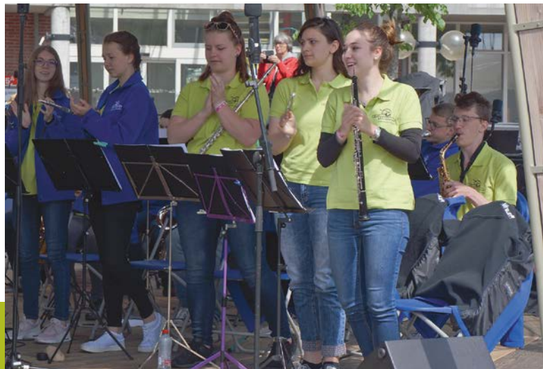
EYMF: Jugendmusik Frauenfeld