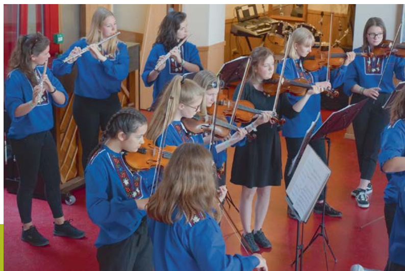
EYMF: Musikschule Wil, Jugendorchester EYMF: Ecole de musique de Wil, orchestre de jeunes

Les groupes régionaux de l'Union européenne des écoles de musique ont notamment pour tâche de traiter de thèmes clés de l'éducation musicale présentant une importance culturelle particulière. C'est ainsi qu'en février 2018, l'ASEM a accueilli le groupe régional LLACHD, constitué de représentants du Liechtenstein, du Luxembourg, d'Autriche, de Suisse