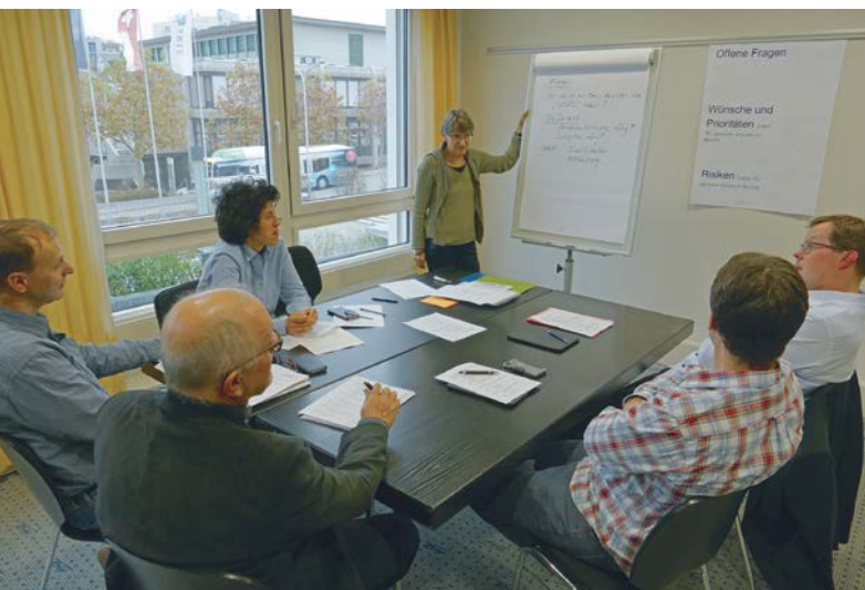
Workshop Begabtenförderung an der November-Delegiertenversammlung / Atelier sur l'encouragement des talents lors de l'Assemblée des délégués de novembre

Les élections de renouvellement du comité de l'ASEM ont constitué le premier temps fort de l'assemblée