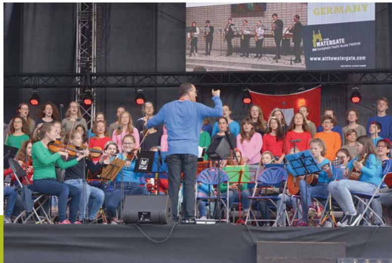
EYMF: Musikschule Matzendorf, MASPIMATZ EYMF: Ecole de musique de Matzendorf, MASPIMATZ