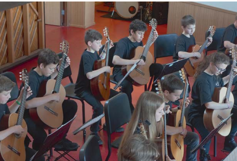
EYMF: Musikschule Brugg, GuitarSoundOrchestra EYMF: Ecole de musique de Brugg, GuitarSoundOrchestra

A l'occasion de son symposium d'automne 2018, l'association allemande des écoles de musique VdM a cherché à renforcer sa collaboration avec son homologue helvétique. Elle souhaitait en particulier profiter des expériences faites par l'ASEM lors de sa campagne en faveur de l'article constitutionnel sur l'encouragement de la formation musicale et de son approche actuelle de la mise en œuvre de celui-ci. Les représentants de tous les Bundesländer ont discuté de manière approfondie de la capacité de leur association à mener campagne et des structures requises à cet effet. Le principe de subsidiarité tel qu'il est pratiqué en Suisse a notamment été mis en exergue lors des débats. Les deux associations se conçoivent comme des organisations apprenantes qui cherchent en permanence à améliorer leur travail au service de l'encouragement musical de la jeunesse.