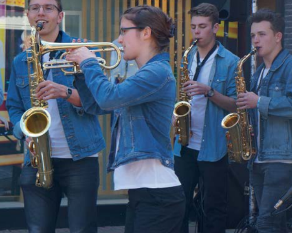
EYMF: Musikschule Thurtal Seerücken, Band Sound around EYMF: Ecole de musique de Thurtal Seerücken, groupe Sound around

tionen) (BL) / Musikschule Stadt Wil (SG) / Regionale Musikschule Gelterkinden (BL) / Regionale Musikschule Sissach (BL) / Scola da musica Grischun Central (GR) / Musikschule Thurtal Seerücken (TG)