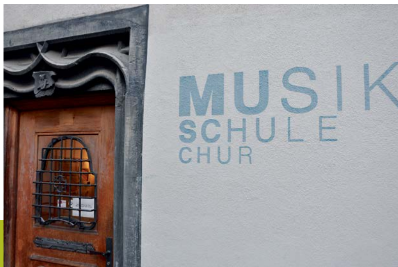
Der VMS-Vorstand zu Besuch beim Verband Sing- und Musikschulen Graubünden / Le comité ASEM en visite auprès de l'association des écoles de musique grisonnes