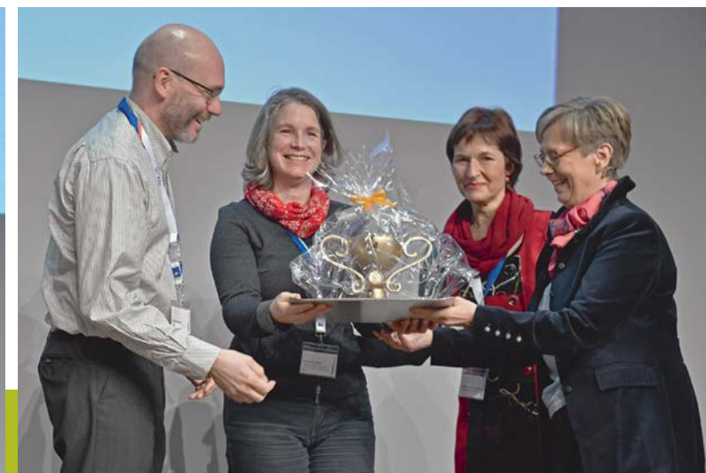
Preisträger des VMS-Wettbewerbs / lauréats du concours de l'ASEM: Musikschule Basel, Musikakademie Basel, 1. Preis / 1 er prix.